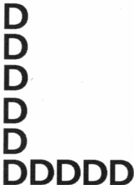
ilustracja 5 [źródło 5 i 7]

Natomiast dominacja lewej półkuli mózgu prowadzi do myślenia o typie sekwencyjnym, czyli „szeregowym”, powoduje wyższą rozdzielczość percepcji, ale ogranicza ogląd całości. Podobno warunkuje postawę, którą można nazwać „zachodnim racjonalizmem” [na podst. źródła 5].